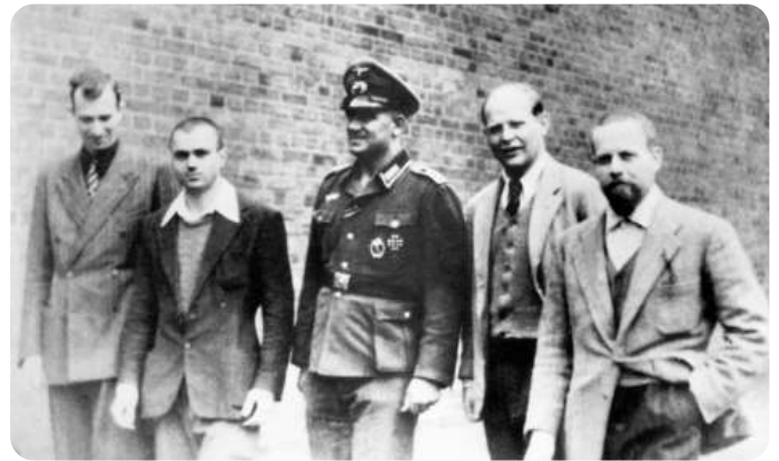
Dietrich Bonhoeffer (tweede van rechts) niet lang voor zijn dood, met een aantal medegevangenen en een Oberfeldwebel in de gevangenis van Berlijn-Tegel.

Maar wij moeten er ook op wijzen dat ze (wij!) terdege moeten voldoen aan de maatstaven waarmee ze (wij!) anderen meten. Overigens zijn de kerken voor hun eigen kwetsbare en eenzame leden heus van groot belang geweest; dat mag dan weer aan de credit zijde genoteerd worden.