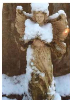
Op Kerstochtend op de begraafplaats; samenspel van een engel die waakt op een graf, door weer en wind. Geen kunstenaar die het zo heeft kunnen bedenken, het ontstaat.....