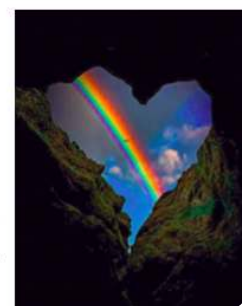
Vanuit een hart vol liefde schijnt de regenboog, teken van hoop; door de wolken heen verschijnt er altijd weer licht aan de horizon.