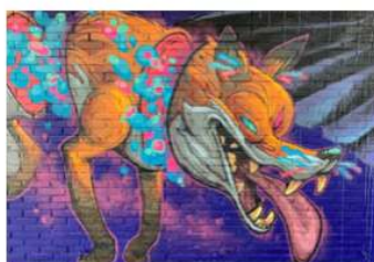
Afgelopen week is de fietsenstalling bij station Ede-Wageningen opgefleurd door Street-Art