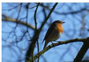
Dit roodborstje onlangs op landgoed kasteel Staverden. Of is het een "Oranje-"borstje?

Maar niet zonder een groot woord van dank aan alle medewerkers van de fotoclub. Wat hebben hun inzet, hun pareltjes van beeld en woord en hun creativiteit ons allen en heel de gemeente onze gang door de afgelopen tijd mooier gemaakt! En daarom deze laatste keer nog even wat pareltjes in Ede opdiepen. Schitterend spel van licht, liefde en kleur..